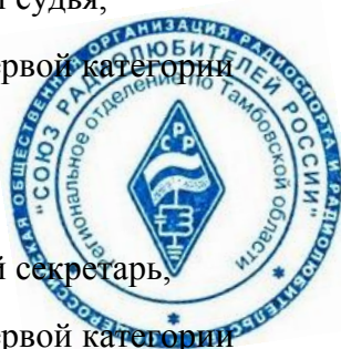
А.Г. Кожевников (UA3RF)

Главный спортивный судья, спортивный судья первой категории